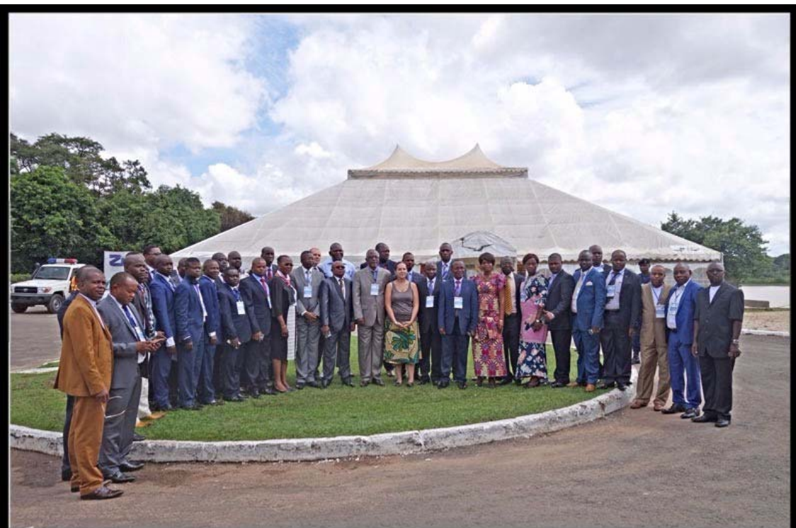
Lubumbashi, 29 February – 1 March 2016

Selon l'OMS, le choléra est chaque année à l'origine de plusieurs dizaines de milliers de morts et la République démocratique du Congo (RDC) concentre une partie importante des cas. Depuis 2007, un programme de lutte contre cette maladie infectieuse et contagieuse a été engagé. Plusieurs acteurs internationaux se sont mobilisés aux côtés des autorités congolaises.